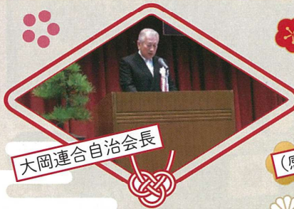
大岡連合自治会長