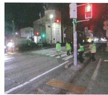
▲各コースでの補導の様子