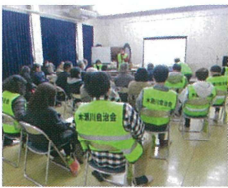
▲防災研修会の様子

防災訓練の後、木瀬川公民館で防災教育の一環として、各協議員・木瀬川自主防災組織正副班長の防災教育の防災研修会が行われた。風水害の場合、台風や大雨による洪水など数日間の避難が必要。風水害時の避難について、防災情報をもとにとるべき行動と、その相当する警戒レベルは、レベル1で、夜間、翌日早朝に大雨警報(土砂災害)に切り替える可能性がある高齢者は危険な場所からの避難が必要とされる警戒レベル3に相当。また、災害警戒レベルは気象庁の発表やニュース、ネット、市の防災無線などで確認！レベルが段階的に上がるのではなく発表時がレベル4以上の場合がある。夜間または深夜の発令もある。さらに、台風は情報が得られやすいが、線状降水帯、竜巻などは注意が必要。風水害(台風や大雨等)の災害規模や状況に応じ、避難所として学校等を開設する。開設する避難所は災害規模や状況によって判断するため、全ての避難所を一齐に開設するとは限らない。避難する際はテレビのdボタン、沼津市危機管理情報メール等で確認。木瀬川の避難場所は大岡南小学校。大規模災害は、家屋倒壊または倒壊の可能性がある場合は避難所に避難する。避難生活については、避難当初は多くの避難者で新聞紙1、2枚程度が1人のスペースの可能性。但し感染症リスクの懸念からパーティションの用意はない。ケガ、病気の方の対応は病院または、地区センターが受け入れ先になる。また、要介護者の対応は基本的には介護施設へ。