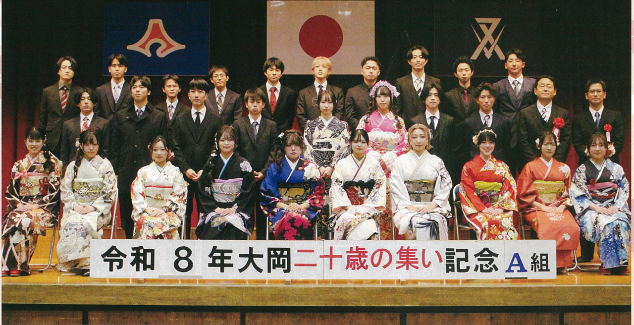
令和 8 年大岡二十歳の集い記念 A組

主催 大岡連合自治会・大岡地区青少年を健やかに育てる会・大岡コミュニティ推進委員会