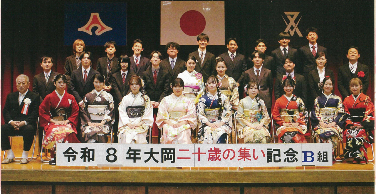
令和 8 年大岡二十歳の集い記念 B組

主催 大岡連合自治会・大岡地区青少年を健やかに育てる会・大岡コミュニティ推進委員会