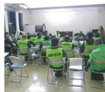
▲補導についての説明

木瀬川自治会(日時)12月5日(金)午後7時より【内容】木瀬川自治会長挨拶の後、補導部長より今回の補導に対して各コース、注意点などの説明。さらに、大岡南小学校・校長先生が、日頃の大岡中学校後援会・地域ボランティア、スクールガードの支援への感謝・御礼の言葉と最近の学校生活の様子を話されました。