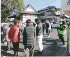
▲木瀬川自治会の防災訓練