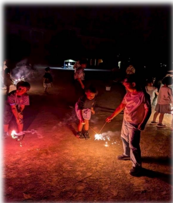
ファイナーレのナイアガラ花火