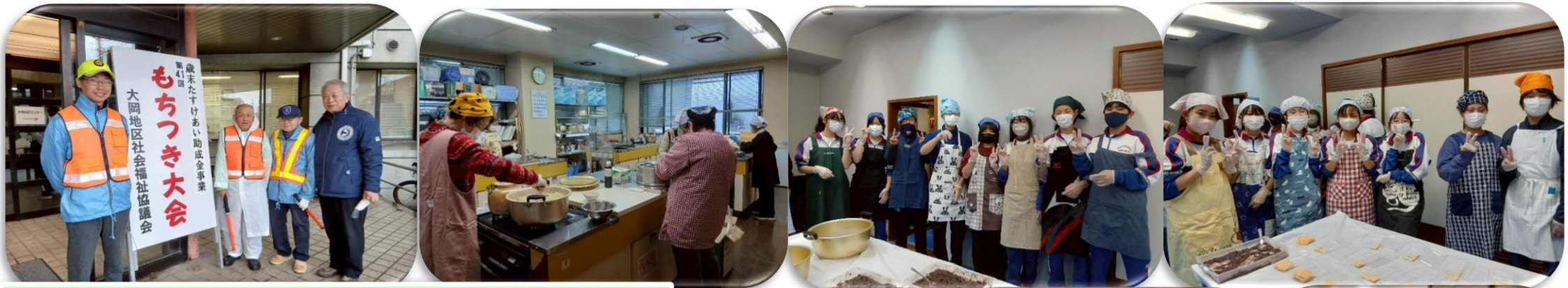
もちつき大会は企画～準備を重ねてきて、そして、本番を迎え、本当に楽しく素晴らしいイベントとなりました。お疲れさまでした。