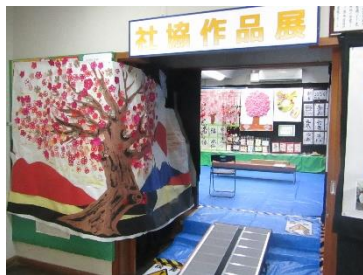
ふれあいレジデンス大岡