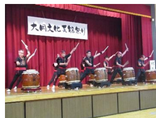
黄瀬川太鼓 祝い太鼓/プロ太鼓奏者/八幡太鼓/きせ川昇り打ち/きせ川まつり