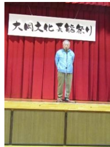
上田連合会長挨拶