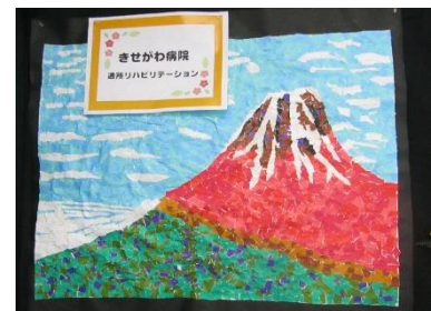
きせがわ病院通所リハビリテーション