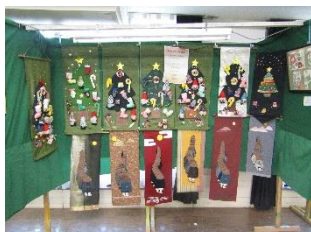
つるし雛同好会(中石田)