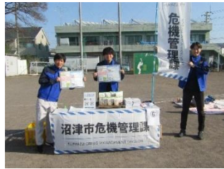
沼津市危機管理課