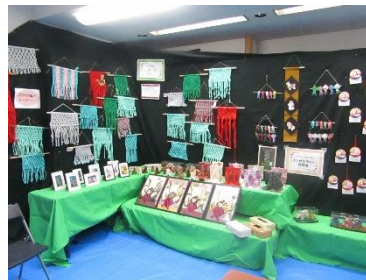
中石田いきいきサロン 中石田自治会・富士町自治会