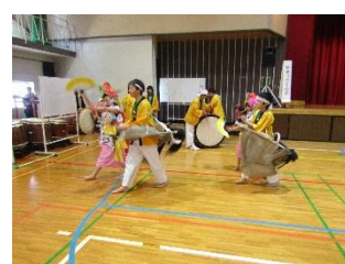
ゆめっこくらぶ(長野) 青森県・荒馬祭/富山県・古代神祭