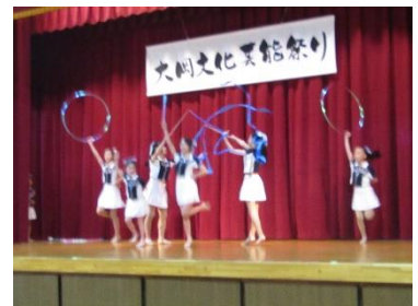
第二耕雲寺新体操クラブ/ライオンキング