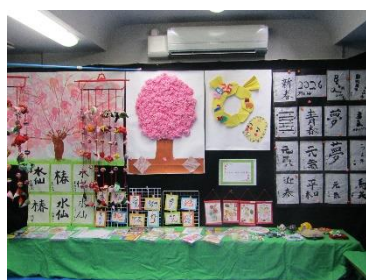
ウェルビーイング大岡