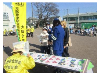
大岡交通安全協会沼津地区支部大岡分会スタンプラリー