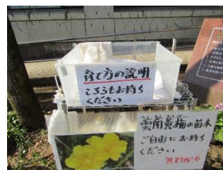
雲南黄梅の苗木無料配布(育て方の説明付き)