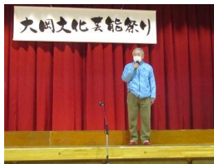
上田大岡連合自治会長開会あいさつ