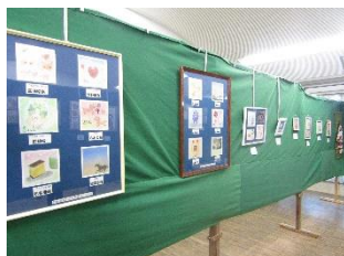
パステル筆文字教室