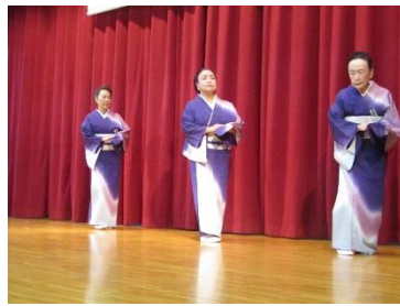
田村流ひまわり会 霧笛の宿