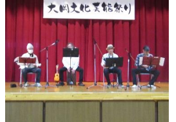
ウクレレヒートルス ス・ワンダフル/