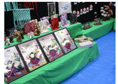
エンゼルサロン研修会