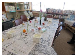
絵手紙体験(談話室)