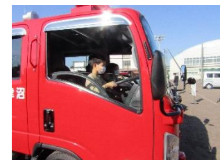
20分団・21分団 消防車試乗会