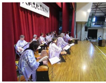
日本の心お江戸日本橋/通りゃんせ/さくら チャイムヒビキ&ソレーナ / 知床旅情他