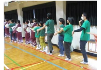
女性部・大岡舞踊の会・他輪踊り 大岡音頭(沼津)/大岡音頭(長野)/ダンシングヒーロー/北国の春