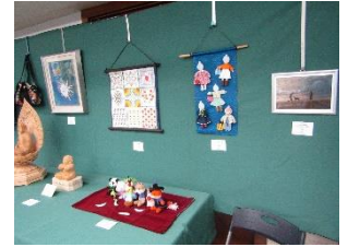
個人作品水墨画短歌綴・他