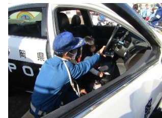
パトロールカー試乗会風景