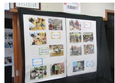
子育て支援・他 社協活動紹介