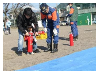
水消火器実演訓練風景