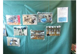
大岡南小学校放課後教室