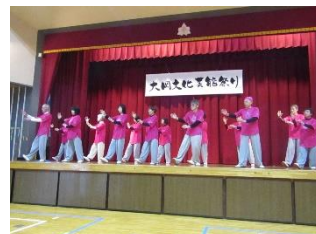
日吉太極拳クラブ 入門初級/二十四式