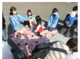
防災紙芝居・新聞紙スリッパ