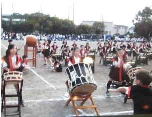
大岡小動画 岡っ子太鼓