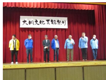
日枝寿大学瑠璃の会 花/糸 ご紹介長野市大岡地区住民自治協議会