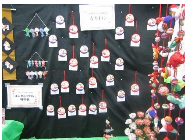
寿サロン・干支(馬)