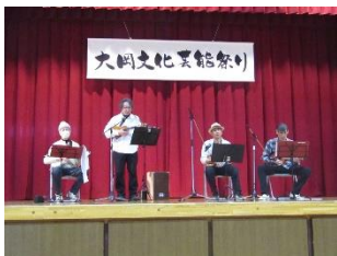
小さな恋のうた/冬の散歩道