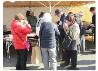
信州手打ちそば実演無料試食会風景