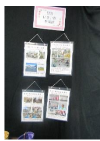
日吉自治会いきいき倶楽部福祉通信パネル