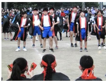
大岡南小動画できっこないをやらなくちゃ/ソーラン節