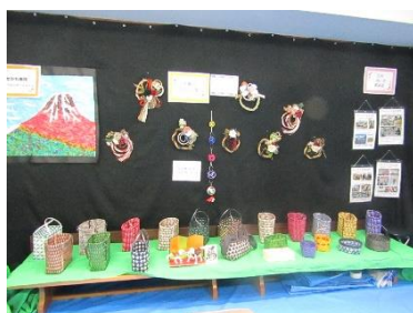
木瀬川自治会きせつ家バッグ・かご・リース