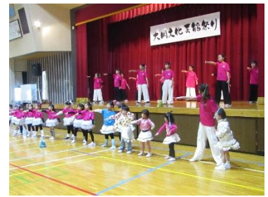
耕雲寺ダンスチーム&dreamyup! タイムトゥシャイン/アドベンチャー/クラブマウスピース