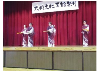
大岡舞踊の会 女の恋/八木節/滝の白糸