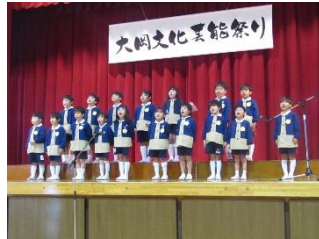
岳東保育園 タイムパラドックス(vaundy)