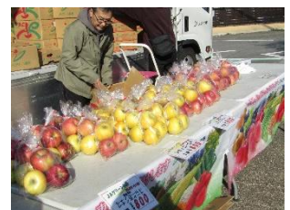
信州特産物即売風景